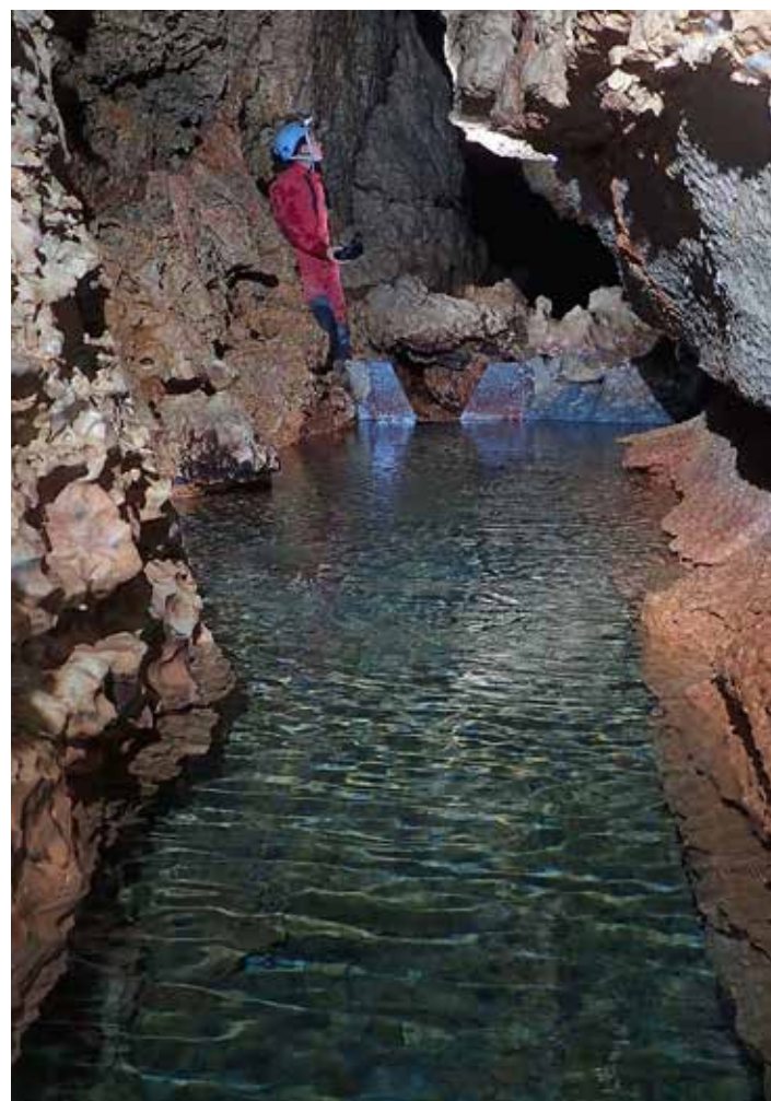
photo du barrage de l'aven de la Bise (mesure du débit souterrain à -140m sur le Larzac)